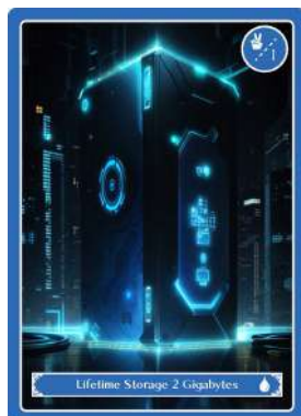
一生の保存2ギガバイト

ファベックス2024展示会で配布される マルイ物産カタログのQRコードを読み取って▶▶