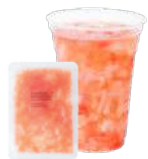
グレープフルーツ&ナタデココ