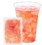
グレープフルーツ& ナタデココ