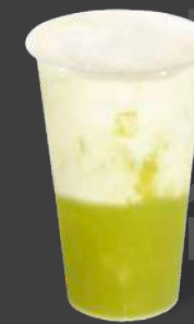
マスクメロンピューレ +シェイク