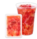
ストロベリー& ナタデココ