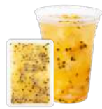
パッションフルーツ& ナタデココ