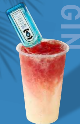
スイカピューレ +ヤクルト+ジン