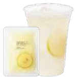
台湾レモン& ナタデココ