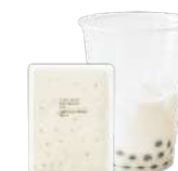
ミルクベース 微糖