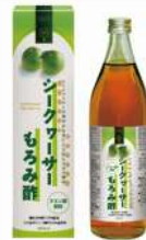
シークワーサーもろみ酢