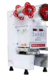
トップシールマシン