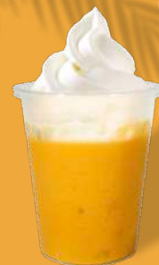
マンゴーピューレ +ソフトクリーム