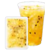
パイナップル&パッション& ナタデココ