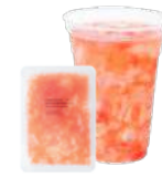
グレープフルーツ& ナタデココ