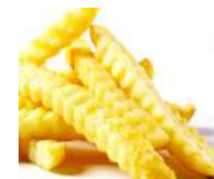
スペシャルカット