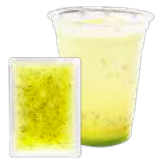
キウイフルーツピューレ