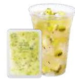
キウイフルーツ& ナタデココ