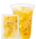
パイナップル&パッション&マンゴー&ナタデココ