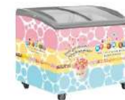
ミニメルツショーケース 冷凍庫 000453