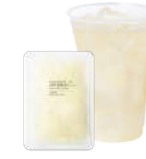
台湾レモン& ナタデココ