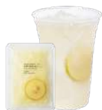
台湾レモン&ナタデココ