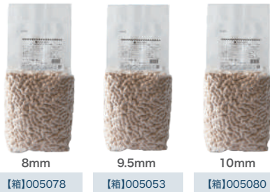
8mm 【箱】005078 9.5mm 【箱】005053 10mm 【箱】005080