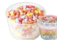
レインボーアイス 【バルク】009906 【カップ】000404