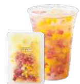
マンゴー&ストロベリー&ナタデココ