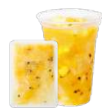
パイナップル&パッション& マンゴー&ナタデココ