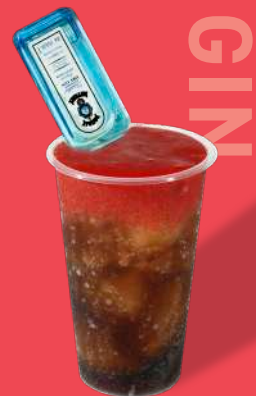
ストロベリーピューレ +コーラ+ジン