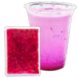
レッドドラゴンフルーツ ピューレ