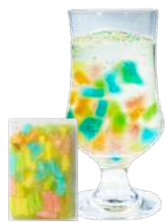
カラフルフンガイ