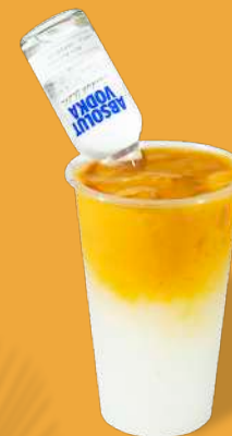
マンゴーピューレ +カルピス+ウォッカ