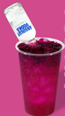
ドラゴンフルーツピューレ +ジンジャエール+ウォッカ