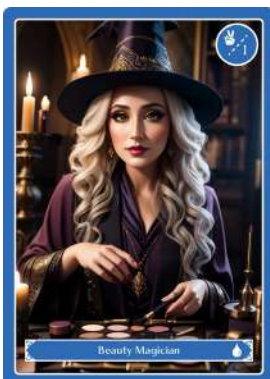
ビューティーマジシャン