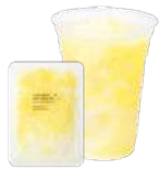
パイナップル& ナタデココ