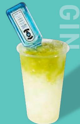
マスクメロンピューレ +カルピス+ジン