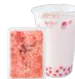
ストロベリー(果肉入り)