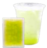
マスクメロンピューレ