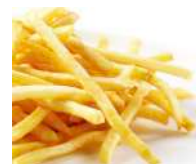
ストレートカット