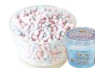
コットンキャンディー 【バルク】009903 【カップ】000400