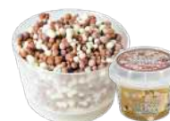
チョコレートバナナ 【バルク】009902 【カップ】000402