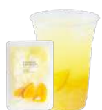
オレンジ&レモン&ナタデココ