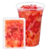
ストロベリー&ナタデココ