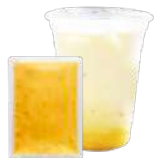
マンゴーピューレ