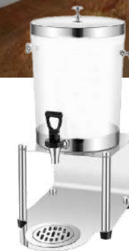
水出し用ディスペンサー 8L