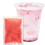
ストロベリーピューレ

ストローがさせる ドリンクボトル かわいいクマやネコの形や オリジナルも受付ます!