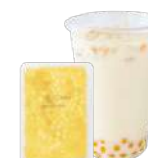
マンゴー(果肉入り)