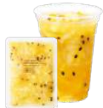
パイナップル&パッション& ナタデココ