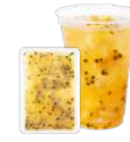
パッションフルーツ& ナタデココ