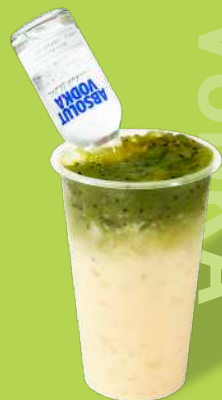
キウイフルーツピューレ +ヤクルト+ウォッカ